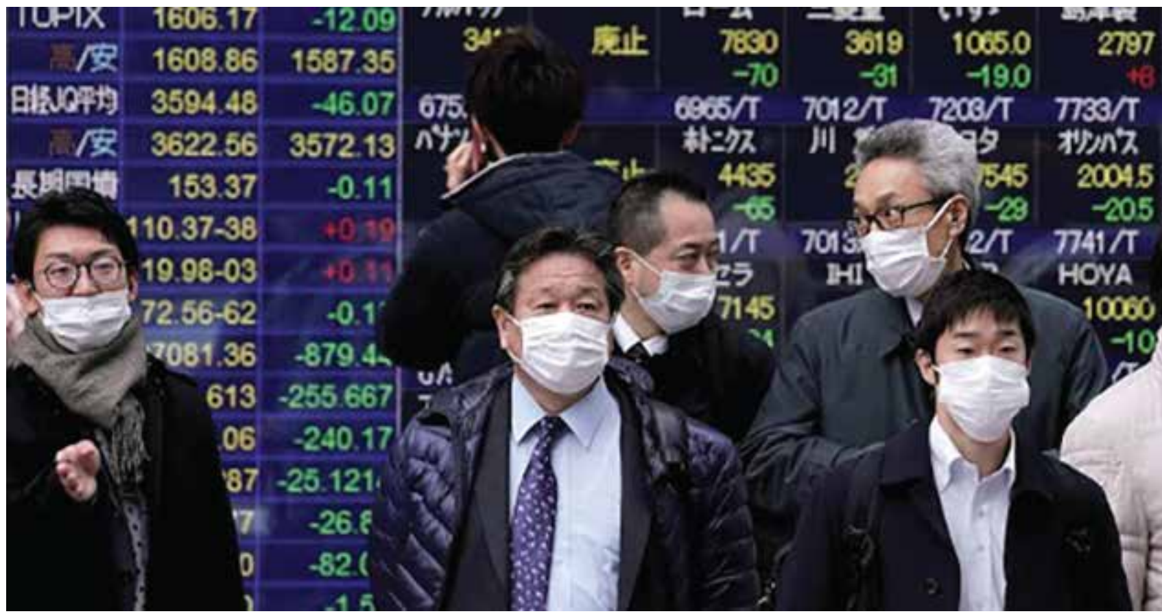
Los mercados de todo el mundo se han desplomado por el impacto del Coronavirus.