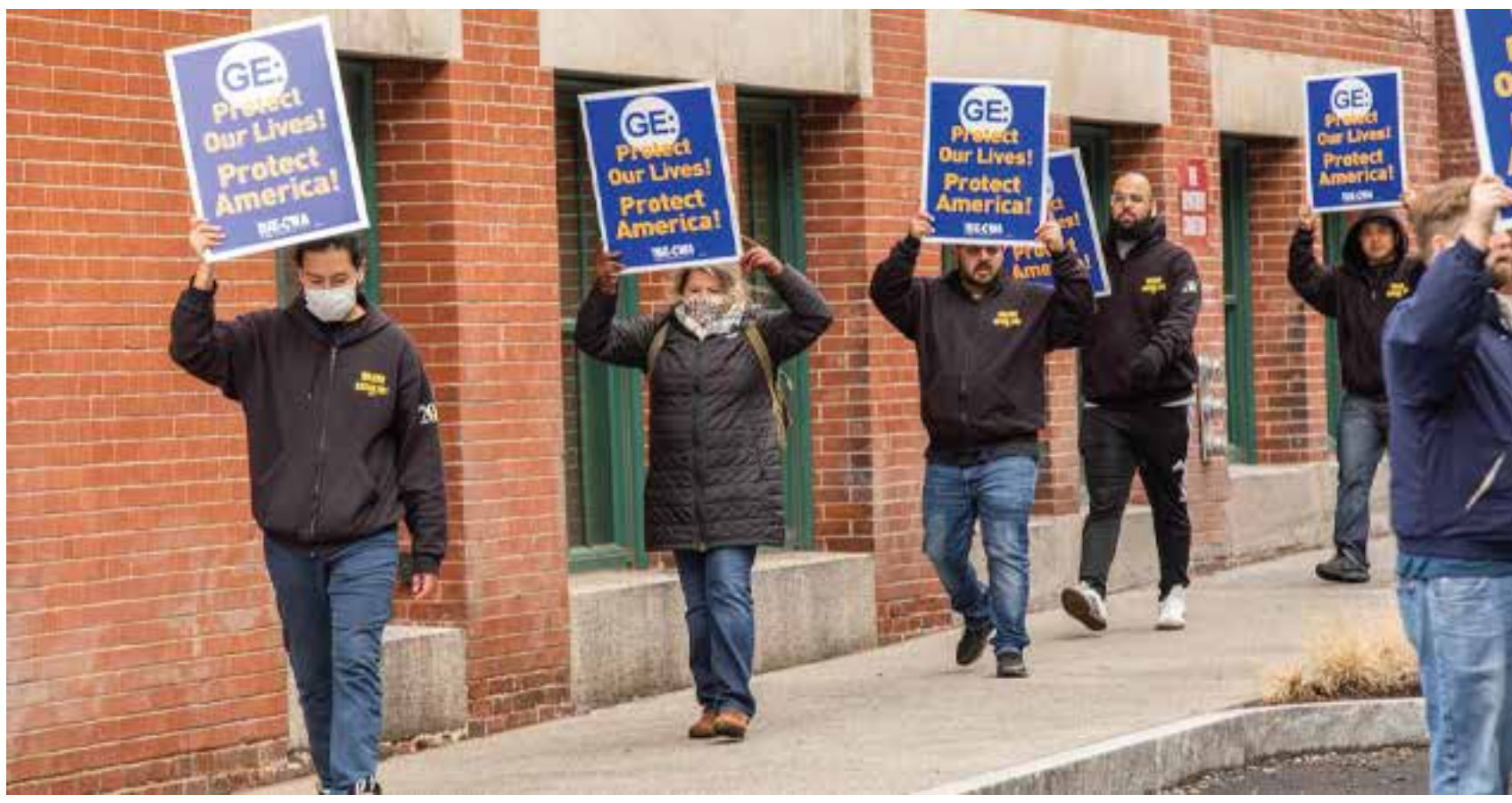
Trabajadores de General Electric se manifiestan para exigir que la empresa recontrate a sus empleados y haga ventiladores.