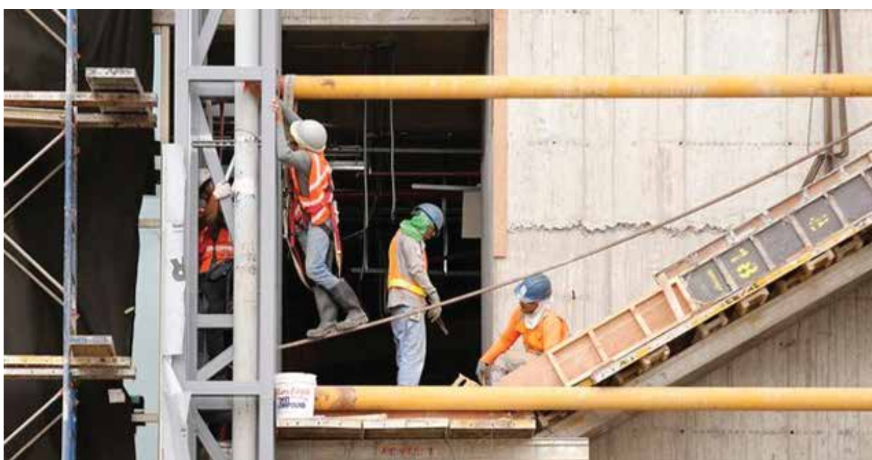
Ampliación del aeropuerto Juan Santamaría, en el 2018.