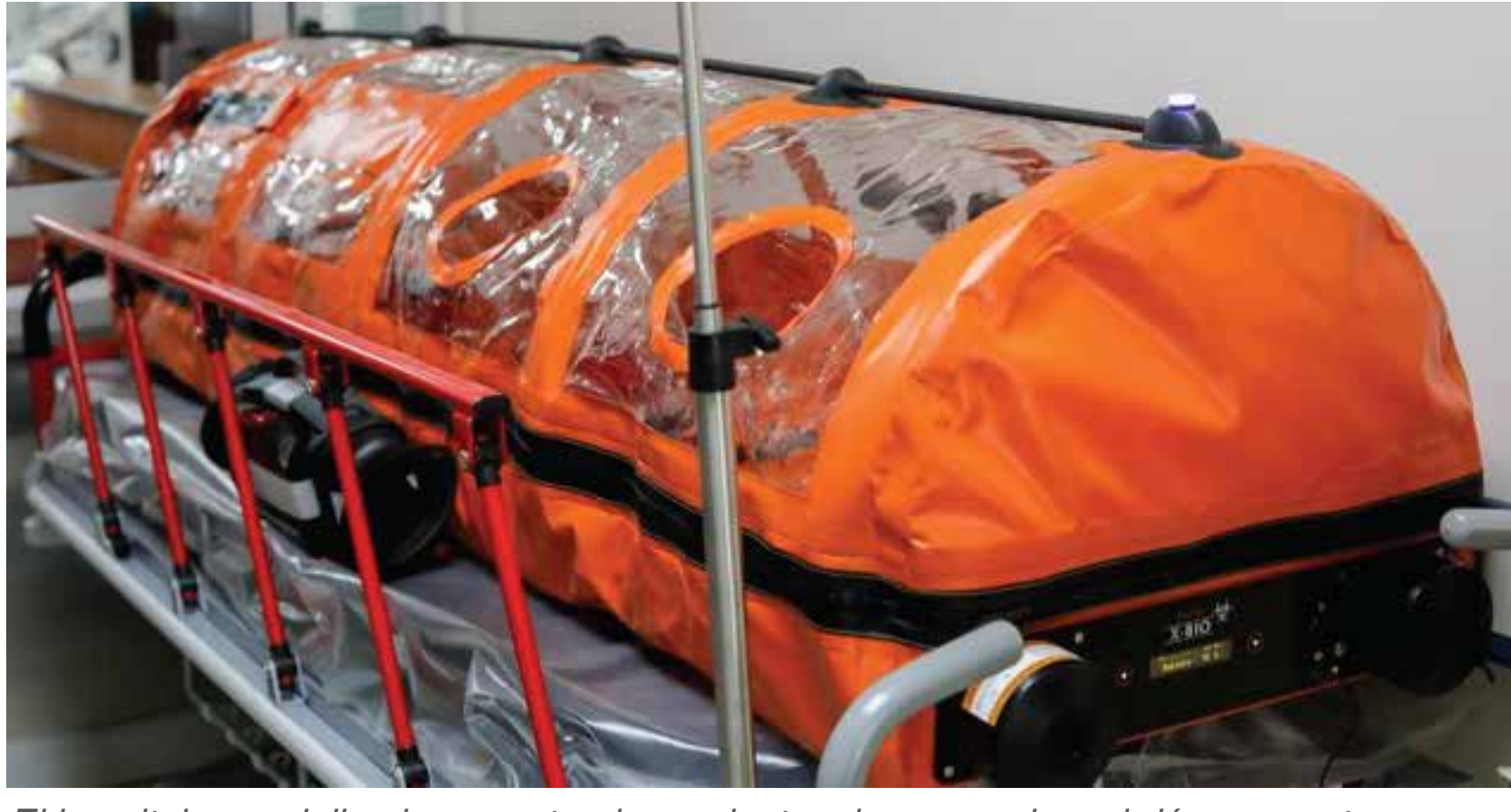
El hospital especializado para atender pacientes de coronavirus abrió sus puertas a finales de marzo.