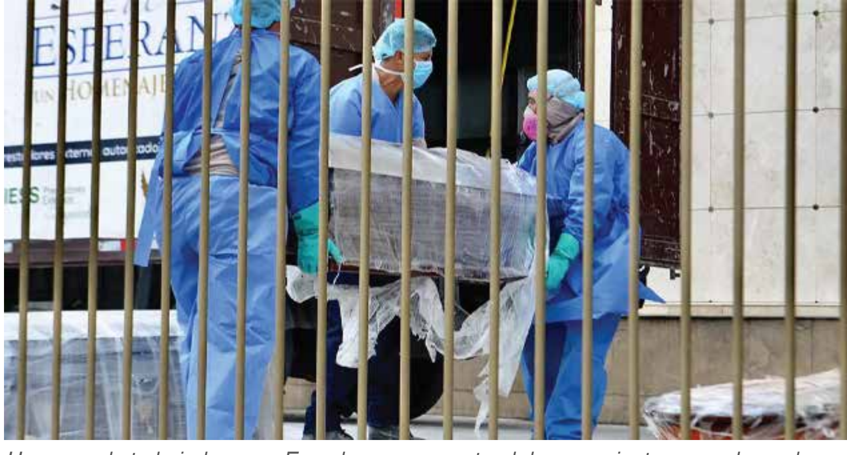
Un grupo de trabajadores en Ecuador sacan un ataúd de un paciente sospechoso de coronavirus.