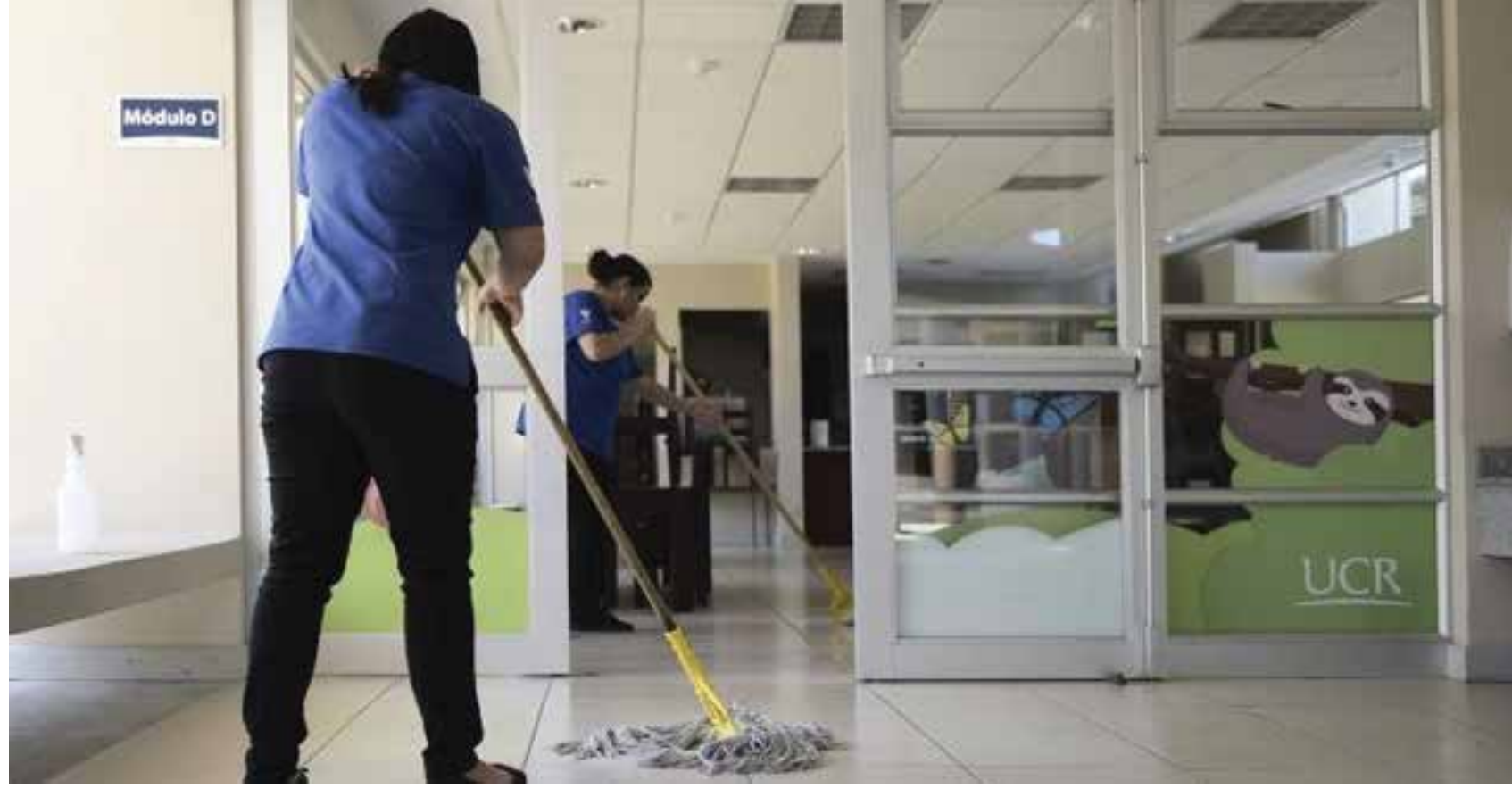
Trabajadoras de Selime limpian el Comedor Infantil en las instalaciones de la Universidad de Costa Rica en San Pedro.