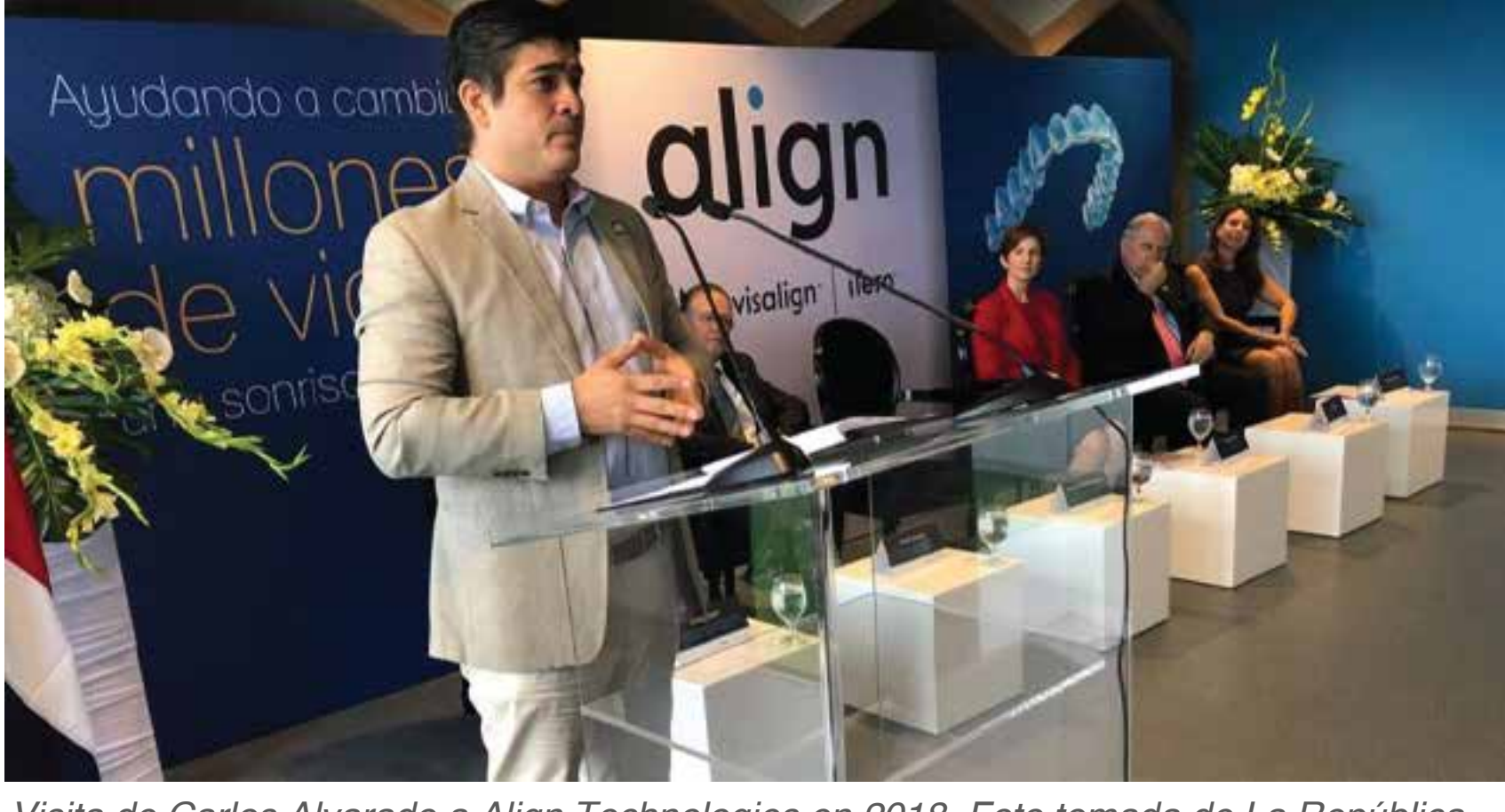
Visita de Carlos Alvarado a Align Technologies en 2018.