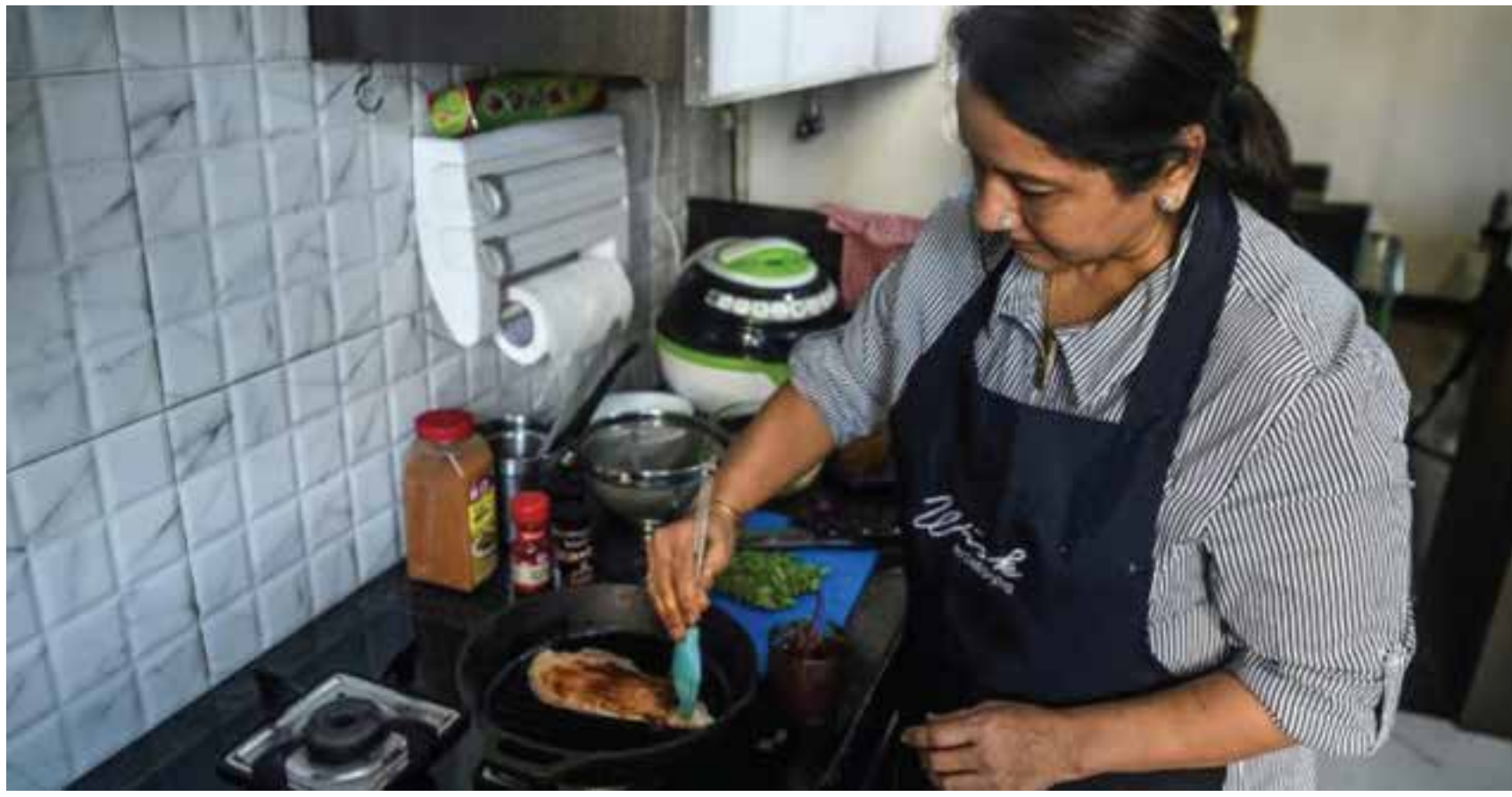
Fotografía con fines ilustrativos.