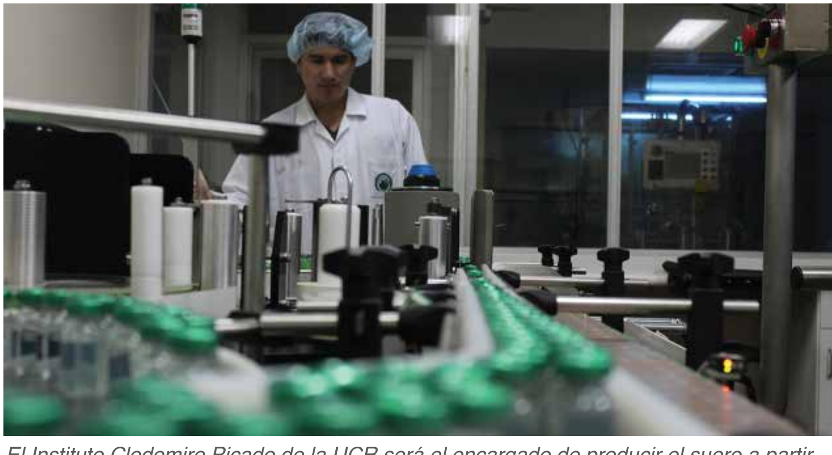
El Instituto Clodomiro Picado de la UCR será el encargado de producir el suero a partir del plasma de pacientes recuperados de COVID.